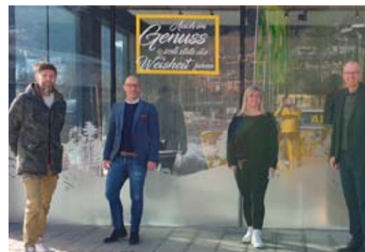
Neue Metzgerei: „DIE LADNEREI“ eröffnet im April.

Der Schnee ist weg und achtlos Weggeworfenes kommt zum Vorschein. Seitens der Gemeinde laden wir daher herzlich zur Aktion „Frühjahrsputz St. Michael“ ein. Lesen wir gemeinsam das auf, was andere „verloren“ haben. Hauptsächlich geht es um Verpackungsmaterial, Dosen, Flaschen und andere achtlos weggeworfene Gegenstände