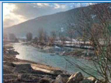
„Die Erweiterung der Murinsel wird wunderschön.“ Bild des Monats eingereicht von Karl Franz Pfeifenberger