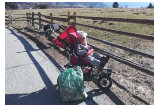
Bitte halten wir St. Michael gemeinsam sauber.