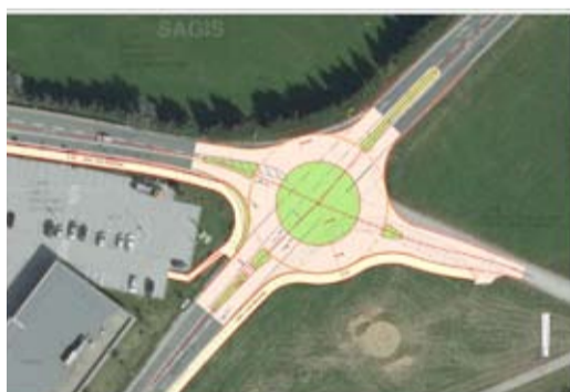
Baubeginn Kreisverkehr Katschbergkreuzung: Mitte Mai.

Die Neugestaltung der Mur im Bereich des geplanten Sport-, Familien- und Freizeitzentrums konnte in den letzten Tagen abgeschlossen werden. In St. Martin wird noch bis Ende Mai gearbeitet. Neben der Aufweitung des Flusses wird derzeit auch der bestehende Geh- und Radweg an die neuen Ufergrenzen verlegt. Zu Beginn des Sommers wird alles fertig